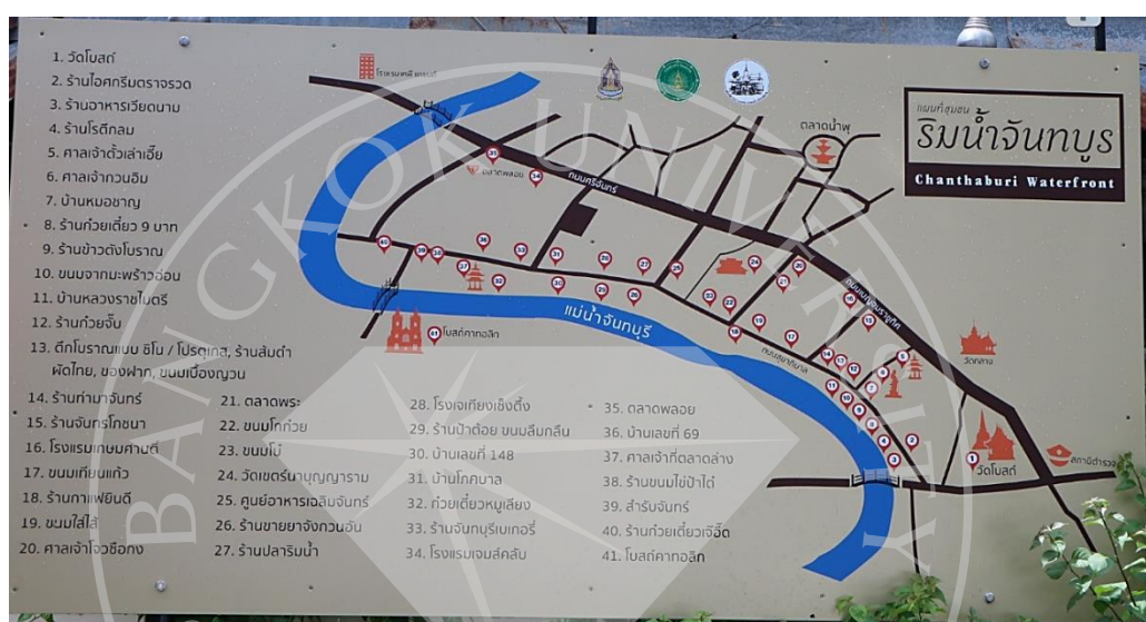
ภาพที่ 1.5: แผนที่ชุมชนริมน้ำจันทบูร

ผู้วิจัยได้ทำการศึกษาพื้นที่ชุมชนริมน้ำจันทบูร อำเภอเมือง จังหวัดจันทบุรี โดยใช้การสัมภาษณ์ในการเก็บข้อมูล