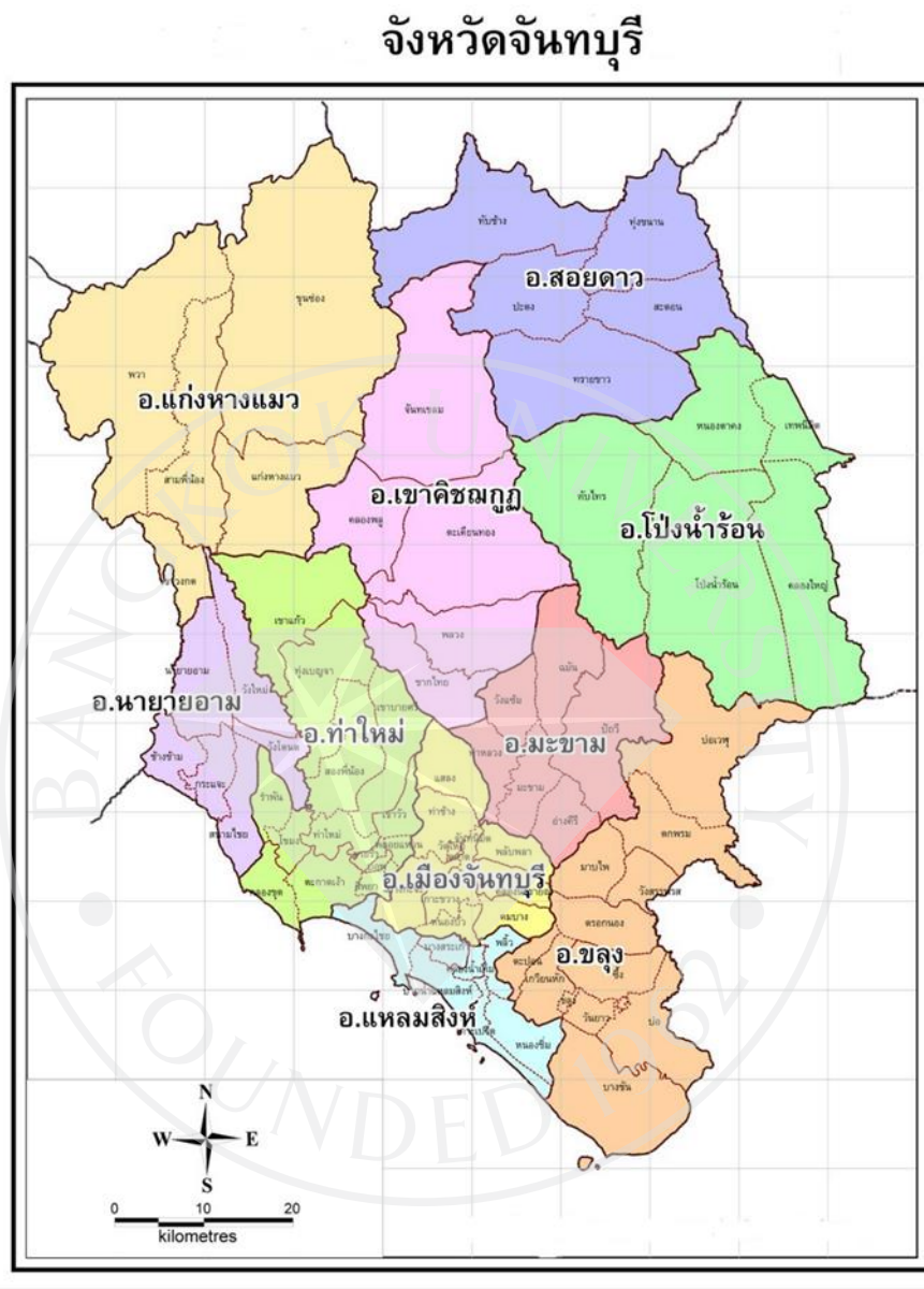
ภาพที่ 1.2: แผนที่จังหวัดจันทบุรี