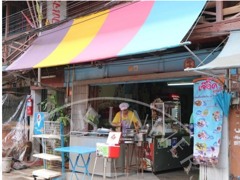
ภาพที่ 4.8: ร้านค้า ร้านอาหารภายในชุมชน