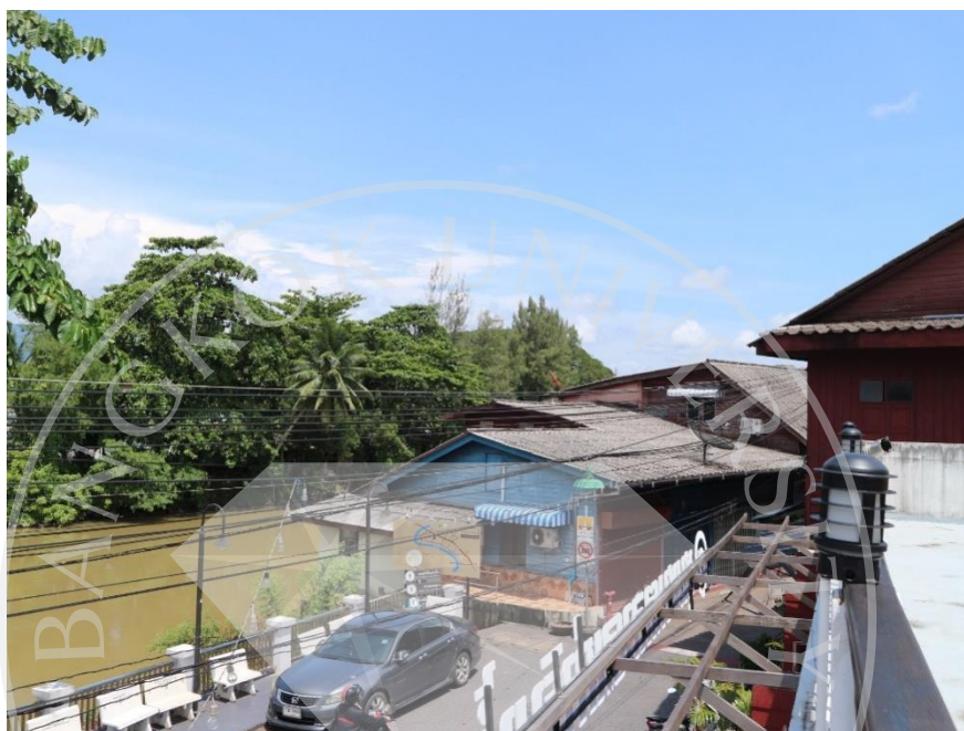
ภาพที่ 4.2: ชุมชนริมน้ำจันทบูร