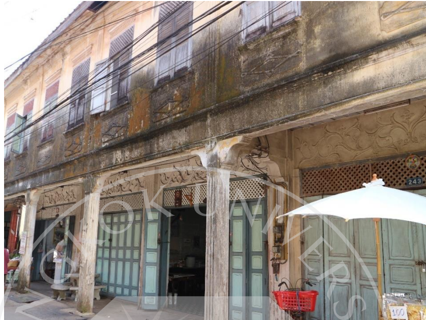
ภาพที่ 4.4: ชุมชนริมน้ำจันทบูร