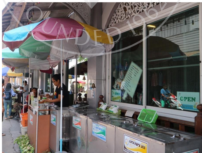
ภาพที่ 4.6: ร้านค้า ร้านอาหารภายในชุมชน