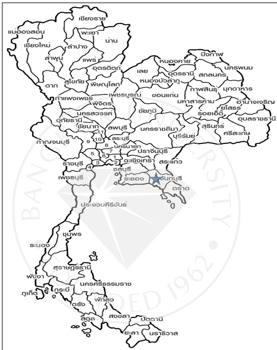
ภาพที่ 1.1: แผนที่ประเทศไทย