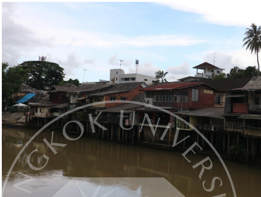
ภาพที่ 1.4: ชุมชนเก่าริมน้ำจันทบูร