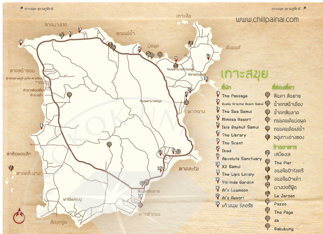
ภาพที่ 1.1: แผนที่ภายในเกาะสมุย