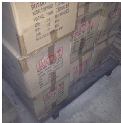
ภาพที่ 1: การจัดเก็บสินค้าตามแผนผังแบบใหม่