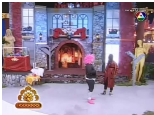
ภาพที่ 5 : ตัวอย่างฉากที่ปรากฏในละคร ตอน โรมิโอ จูเลียต

มีการสร้างฉากขึ้นมาให้สอดคล้องกับเนื้อหาของเรื่องที่เกี่ยวข้องกับวรรณคดีของไทย เรื่อง ไกรทอง โดยเป็นบ้านเรือนไทยสมัยก่อน และมีคลองอยู่หน้าบ้าน โดยเป็นการเสริมสร้างบรรยากาศให้เนื้อหาของละคร และยังช่วยเสริมในการแสดงอีกด้วย ซึ่งมีการใช้คลองเป็นสถานที่ที่ตะเภาแก้วลงไปเล่นน้ำจนทำให้ถูกชาละวันจับตัวไป รวมไปถึงเป็นที่อยู่อาศัยของชาละวันในเรื่องด้วย