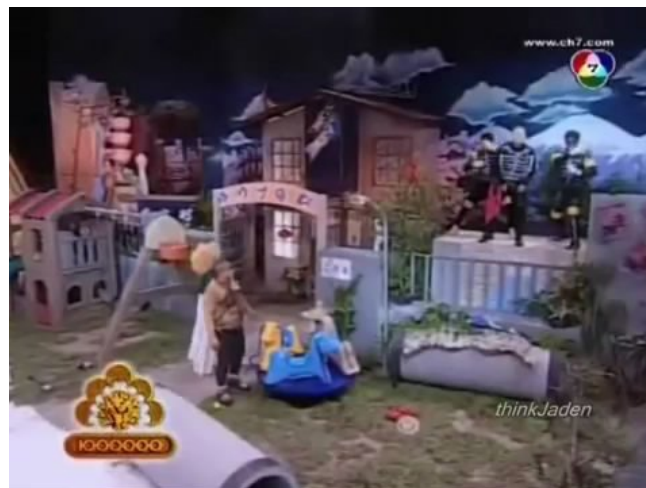
ภาพที่ 7 : ตัวอย่างฉากที่ปรากฏในละครสามช่า ตอน ขบวนการสามช่า TREE RANGER

ได้มีการทำฉากเมืองจำลองขนาดเล็กขึ้นมา เพื่อช่วยเสริมในการแสดงให้กับปีศาจอีเกิ้ล 777 ในละคร ได้อาละวาดและทำลายบ้านเมืองในตอนเปิดเรื่อง เพื่อแสดงให้เห็นถึงบรรยากาศของ พลังอำนาจในการทำลายล้างของปีศาจในเรื่องนี้