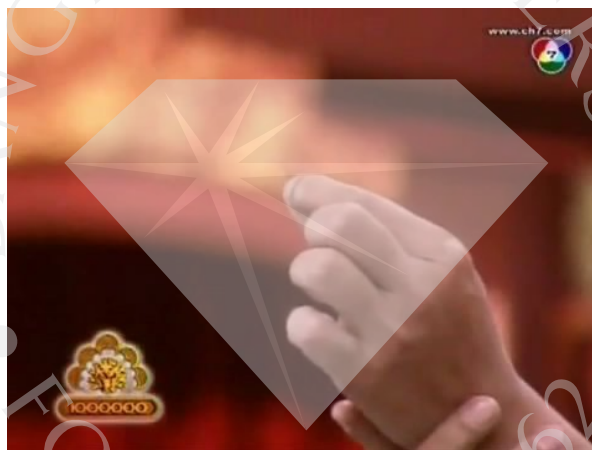
ภาพที่ 18 : ตัวอย่างภาพ Close up Shot ที่ปรากฏในละครสามช่า ตอน ชาละวัน ท ทรี ใจพี่ อยู่ที่เธอ