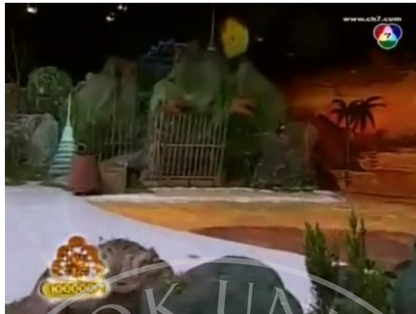
ภาพที่ 11 : ตัวอย่างภาพ Full Shot ที่ปรากฏในละครสามช่า ตอน จุ้นจ้าน เตี้ย อ้วน ฤ