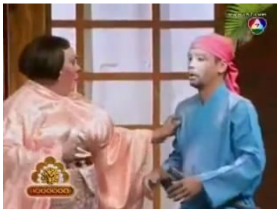
ภาพที่ 14 : ตัวอย่างภาพ Medium Shot ที่ปรากฏในละครสามช่า ตอน สงคราม ความรัก นักดนตรี