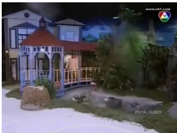
ภาพที่ 5 : ตัวอย่างฉากที่ปรากฏในละคร ตอน โรมิโอ จูเลียต