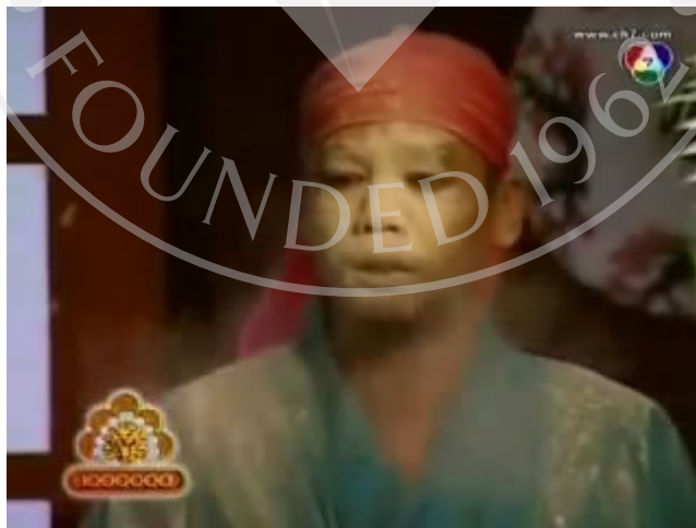
ภาพที่ 16 : ตัวอย่างภาพ Close up Shot ที่ปรากฏในละครสามช่า ตอน เกอิชา 2009

เป็นการถ่ายภาพให้เห็นถึงแป้งที่เปราะอยู่บนใบหน้าของเท่งแบบใกล้ชิดๆ จากการถูกคลื่น แก๊สในเรื่อง ทำให้ผู้ชมได้เห็นภาพอย่างชัดเจน และเกิดเสียงหัวเราะตามมา