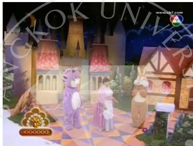
ภาพที่ 8 : ตัวอย่างฉากที่ปรากฏในละครสามซ่า ตอน ซินเดอเรลล่า ฝันเข้าใครอย่าแตะ

จากเนื้อหาของละครที่มีความเกี่ยวข้องกับนิทานเรื่องซินเดอเรลล่า จึงมีการออกแบบฉากต่างๆ ให้ออกมาตรงกับลักษณะที่ปรากฏอยู่ในนิทานเรื่องนี้ ทั้งบ้านของซินเดอเรลล่า และตัวปราสาทที่เป็นที่พำนักของเจ้าชายในเรื่อง รวมทั้งสีสันต่างๆ ที่ปรากฏในฉาก ทำให้เป็นการสร้างบรรยากาศให้เหมือนกับอยู่ในนิทานเรื่องนี้จริงๆ โดยเป็นการสรรสร้างขึ้นมาให้ละครตอนนี้มีความน่าสนใจเพิ่มมากขึ้น