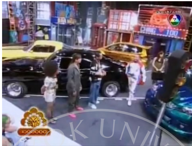
ภาพที่ 9 : ตัวอย่างฉากที่ปรากฏในละครสามช่า ตอน The Fast & The Serious เร็ว แรง นรกชัดๆ

ในละครตอนนี้ เป็นฉากที่สร้างขึ้นมาให้เหมือนกับว่ากำลังอยู่ในเมือง ลอสแอนเจลิส ประเทศ อเมริกา ซึ่งเป็นสถานที่แหล่งชุมนุมของแก๊งแข่งรถซึ่งทั้งหลาย และสิ่งที่แสดงให้เห็นถึงความเป็นประเทศอเมริกาที่ปรากฏในฉากก็คือ ป้ายชื่ออาคารร้านค้าต่างๆ ที่เป็นตัวหนังสือภาษาอังกฤษ จึงทำให้ละครตอนนี้ มีความสอดคล้องและมีบรรยากาศเหมือนกับตัวภาพยนตร์ต้นฉบับเรื่อง The Fast And The Furious ได้อย่างลงตัว