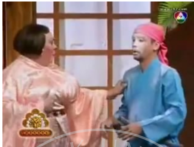
ภาพที่ 14 : ตัวอย่างภาพ Medium Shot ที่ปรากฏในละครสามช่า ตอน สงคราม ความรัก นักดนตรี