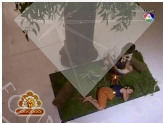
ภาพที่ 21 : ตัวอย่างภาพ มุมสายตานก (Bird's eye View) ที่ปรากฏในละครสามช่า ตอน The Fast & The Serious เร็ว แรง นรกซัดๆ