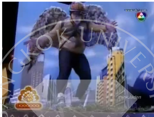
ภาพที่ 6 : ตัวอย่างฉากที่ปรากฏในละครสามช่า ตอน ขบวนการสามช่า TREE RANGER

ได้มีการทำฉากเมืองจำลองขนาดเล็กขึ้นมา เพื่อช่วยเสริมในการแสดงให้กับปีศาจอีเกิ้ล 777 ในละคร ได้อาละวาดและทำลายบ้านเมืองในตอนเปิดเรื่อง เพื่อแสดงให้เห็นถึงบรรยากาศของ พลังอำนาจในการทำลายล้างของปีศาจในเรื่องนี้