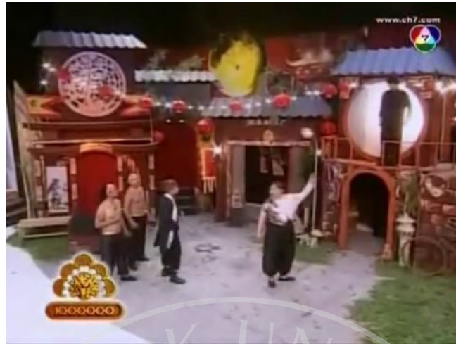
ภาพที่ 2 : ตัวอย่างฉากที่ปรากฏในละครสามช่า ตอน จุ้นจ้าน เตี้ย อ้วน ฉู

ฉากที่ปรากฏในละครตอนนี้ มีลักษณะเป็นอาคารบ้านเรือนสไตล์แบบจีนในสมัยอดีต อาคารแต่ละหลังมีการใช้สีแดงเป็นหลัก ซึ่งเข้ากับวัฒนธรรมของคนจีนที่ชื่นชอบสีแดง โดยในเนื้อหาของเรื่องนี้เป็นการเล่นถึงเหตุการณ์ในอดีต ที่เกิดขึ้นในประเทศจีน จึงมีการใช้ฉากในแบบลักษณะดังกล่าว เพื่อเป็นการเสริมสร้างบรรยากาศให้กับละคร และยังช่วยเสริมในการแสดงของพระเอก ในการปรากฏตัวออกมาบนชั้น 2 ของอาคารอีกด้วย