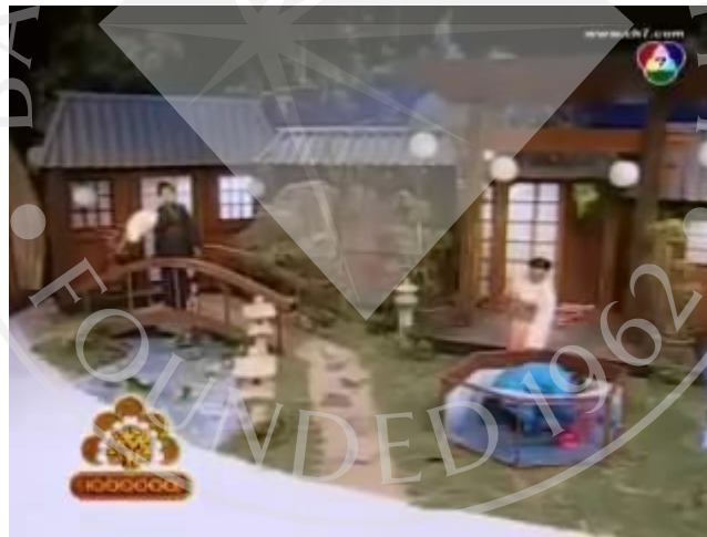
ภาพที่ 1 : ตัวอย่างฉากที่ปรากฏในละครสามช่า ตอน เกอิชา 2009

เนื้อหาของละครสามช่า ตอน เกอิชา 2009 เป็นเรื่องเกี่ยวกับวัฒนธรรมของประเทศญี่ปุ่น ในอดีต จึงมีการสร้างฉากให้สัมพันธ์กับละคร โดยมีทั้งบ้าน สะพาน และสวนที่เป็นการออกแบบ ในสไตล์ญี่ปุ่นของสมัยก่อน ทำให้ช่วยเสริมสร้างบรรยากาศให้ดูเหมือนว่ากำลังอยู่ในยุคสมัยนั้น ในประเทศญี่ปุ่น อีกทั้งยังเป็นการเสริมในเรื่องของการแสดงด้วย อาทิเช่น การเดินข้ามสะพานของ เหล่าตัวละครต่างๆ การลงไปแอบในบ่อน้ำของพระเอกในเรื่อง เป็นต้น