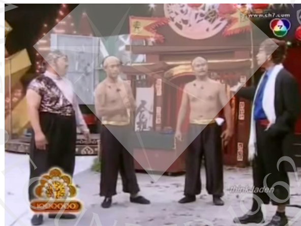
ภาพที่ 12 : ตัวอย่างภาพ Full Shot ที่ปรากฏในละครสามช่า ตอน โรมิโอ จูเลียต