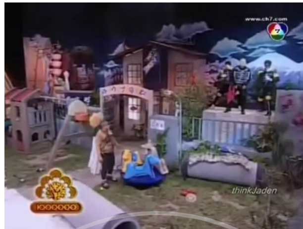
ภาพที่ 8 : ตัวอย่างฉากที่ปรากฏในละครสามช่า ตอน ซินเดอเรลล่า ฝันเข้าใครอย่าแตะ