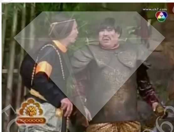
ภาพที่ 15 : ตัวอย่างภาพ Medium Shot ที่ปรากฏในละครสามช่า ตอน ชาละวัน ทู ตรี ใจพี่ อยู่ที่เธอ