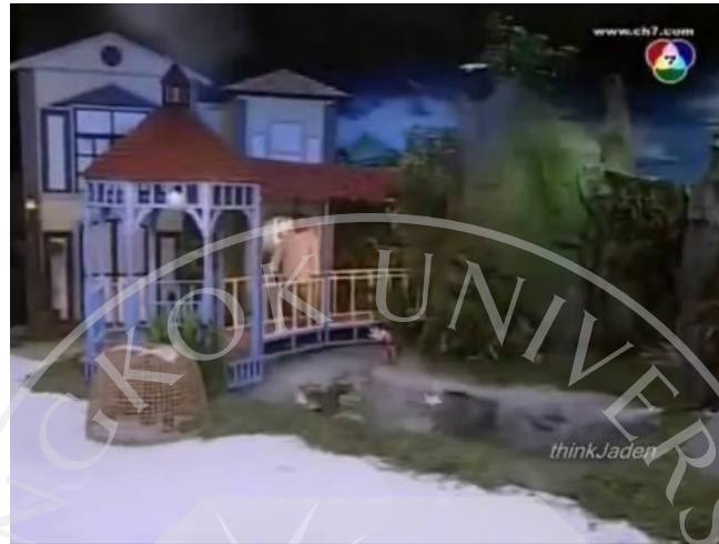
ภาพที่ 4 : ตัวอย่างฉากที่ปรากฏในละคร ตอน ชาละวัน ทู ทรี ใจที่อยู่ที่เขา

มีการสร้างฉากขึ้นมาให้สอดคล้องกับเนื้อหาของเรื่องที่เกี่ยวข้องกับวรรณคดีของไทย เรื่อง ไกรทอง โดยเป็นบ้านเรือนไทยสมัยก่อน และมีคลองอยู่หน้าบ้าน โดยเป็นการเสริมสร้างบรรยากาศให้เนื้อหาของละคร และยังช่วยเสริมในการแสดงอีกด้วย ซึ่งมีการใช้คลองเป็นสถานที่ที่ตะเภาแก้วลงไปเล่นน้ำจนทำให้ถูกชาละวันจับตัวไป รวมไปถึงเป็นที่อยู่อาศัยของชาละวันในเรื่องด้วย