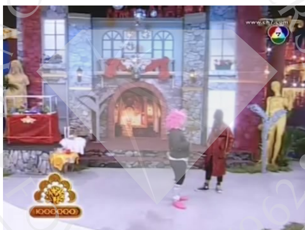
ภาพที่ 6 : ตัวอย่างฉากที่ปรากฏในละครสามช่า ตอน ขบวนการสามช่า TREE RANGER