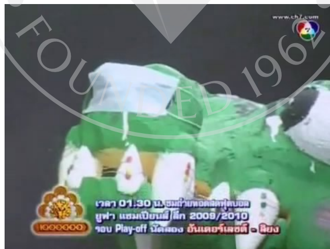
ภาพที่ 18 : ตัวอย่างภาพ Close up Shot ที่ปรากฏในละครสามช่า ตอน ชาละวัน ท ทรี ใจ พี่อยู่ที่เธอ

เป็นการถ่ายภาพที่แสดงให้เห็นถึงผ้าปิดปากที่อยู่บนจมูกของ Prop ที่เป็นหัวจระเข้ในระยะเวลาใกล้ เพื่อเป็นการสื่อให้เห็นถึงวิธีการป้องกันไข้หวัดใหญ่ 2009 ที่สอดแทรกลงไปในการตอนนี้