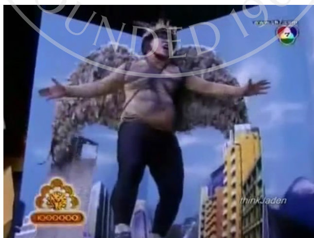
ภาพที่ 22 : ตัวอย่างภาพ มุมต่ำ (Low Angle Shot) ที่ปรากฏในละครสามช่า ตอน ขบวนการสามช่า TREE RANGER

มุมมองสายตานก (Bird's eye View) ที่นิยมใช้กันในงานภาพยนตร์ และไม่ค่อยนำมาใช้กันในงานละครนั้น แต่ทางด้านละครสามช่ากลับได้มีการนำเอามุมมองนี้มาใช้ในละครบางตอน เพื่อเป็นการสร้างมุมมองที่มีความแปลกใหม่ แปลกตา ให้กับละครมากขึ้น รวมถึงมุมมองสายตานก (Bird's eye View) น่าจะใกล้เคียงกับเรื่องจากภาพยนตร์ดัดแปลงมาเป็นละครสามช่าด้วย