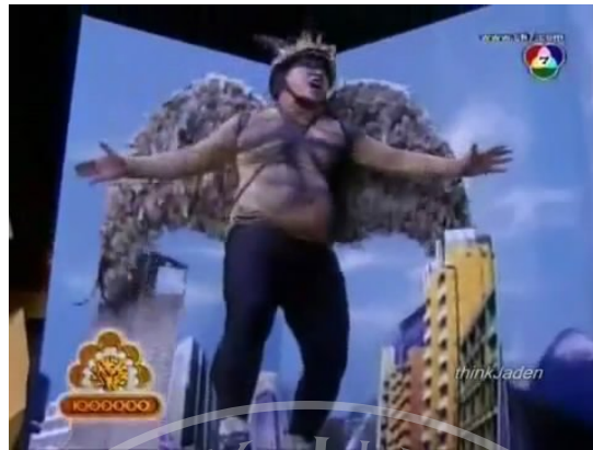
ภาพที่ 23 : ตัวอย่างภาพการใช้เทคนิคพิเศษที่ปรากฏในละครสามช่า ตอน จุ้นจ้าน เตี้ย อ้วน นู