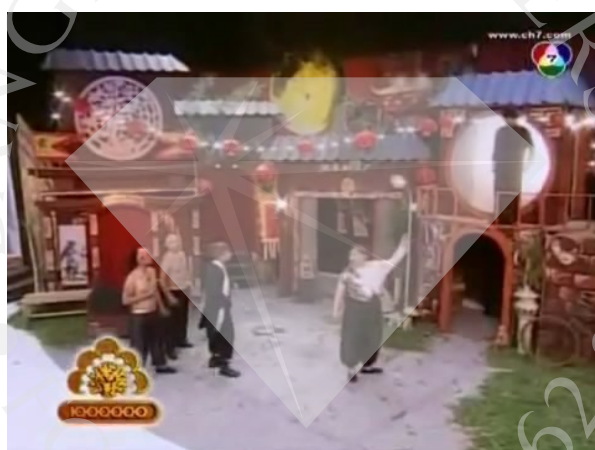
ภาพที่ 3 : ตัวอย่างฉากที่ปรากฏในละครสามช่า ตอน สงคราม ความรัก นักดนตรี