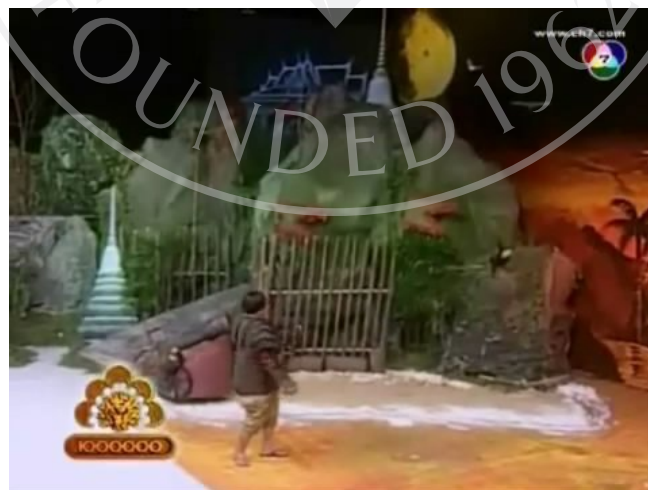
ภาพที่ 3 : ตัวอย่างฉากที่ปรากฏในละครสามช่า ตอน สงคราม ความรัก นักคนตรี

มีการออกแบบฉากให้อยู่ในยุคสมัยรัตนโกสินทร์ของไทย เพราะข้าศึกในตอนนี้ได้ยกพลบุกมาทางทะเล จึงสอดคล้องกับยุคสมัยรัตนโกสินทร์ เพราะเป็นเมืองที่อยู่ใกล้ทะเลมากที่สุด จึงทำให้สอดคล้องกับเนื้อหาของเรื่อง ที่เกี่ยวกับการทำสงครามเพื่อปกป้องบ้านเมืองในอดีตของไทย