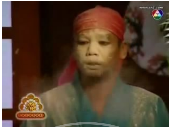
ภาพที่ 17 : ตัวอย่างภาพ Close up Shot ที่ปรากฏในละครสามช่า ตอน จุ้นจ้าน เตี้ย อ้วนฉุ