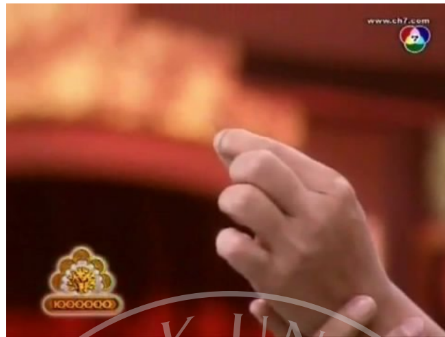
ภาพที่ 17 : ตัวอย่างภาพ Close up Shot ที่ปรากฏในละครสามช่า ตอน จุ้นจ้าน เตี้ย อ้วนงู

การถ่ายภาพที่เน้นไปที่ขมจกแร่ของแท่งที่อยู่ในมือของโหน่ง จากการที่ถูกโหน่งแก้งดึงขมจกแร่ของแท่งออกมาในเรื่อง เพื่อเป็นการโชว์ให้เห็นคุณเห็นว่าได้ทำการดึงขมจกแร่ของแท่งออกมาจริงๆ