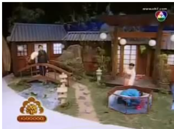
ภาพที่ 2 : ตัวอย่างฉากที่ปรากฏในละครสามช่า ตอน จุ้นจ้าน เตี้ย อ้วน ทุ