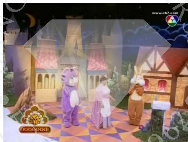
ภาพที่ 9 : ตัวอย่างฉากที่ปรากฏในละครสามช่า ตอน The Fast & The Serious เร็ว แรง นรกซัดๆ