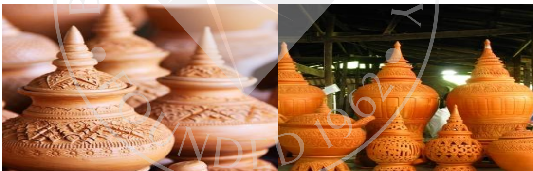
ภาพที่ 2.6: เครื่องปั้นดินเผาเกาะเกร็ด