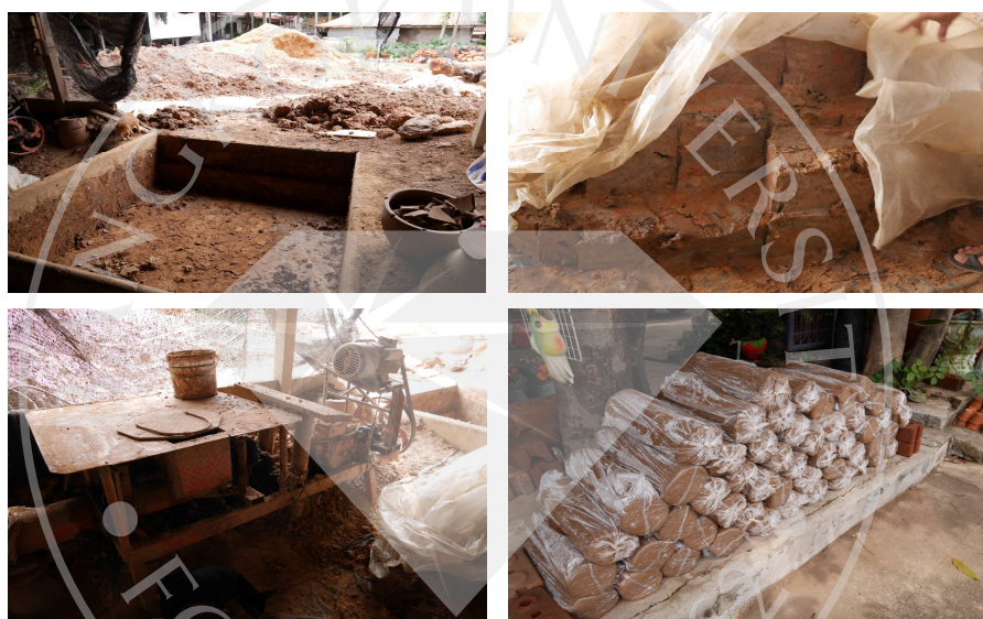
ภาพที่ 2.2: การเตรียมดิน