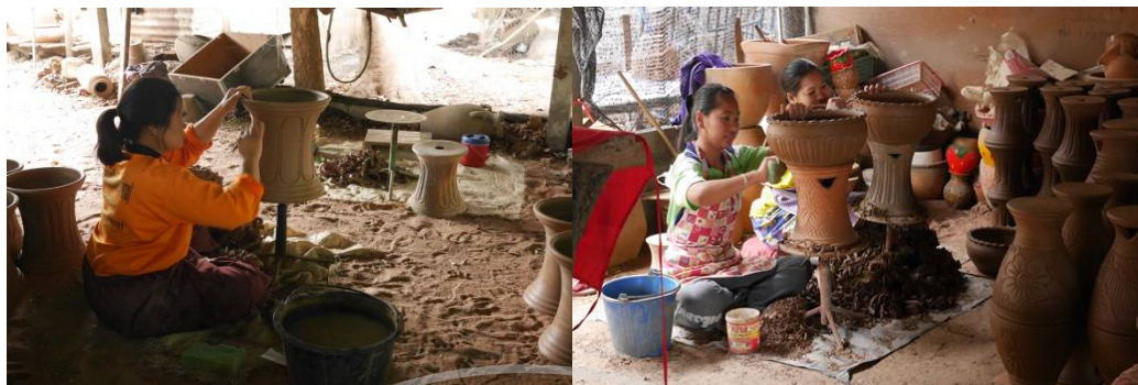
ภาพที่ 2.3: การตกแต่ง