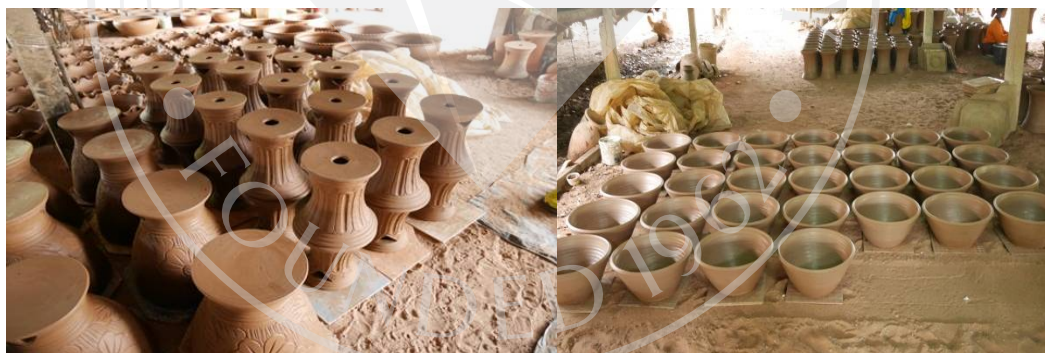
ภาพที่ 2.4: การผึ่ง

นำภาชนะที่ขึ้นรูปเสร็จแล้วไปผึ่งที่โรงผึ่ง ซึ่งสร้างเป็นโรงหญ้าหลังคาคลุมถึงพื้นป้องกันลม แดด ฝน พื้นเป็นทราย ใช้เวลาผึ่งตามฤดูกาล เช่นฤดูแล้ง 15-20 วัน ฤดูฝน 30 วัน เป็นต้น