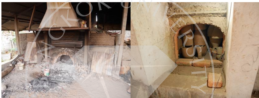
ภาพที่ 2.5: เตาเผาแบบปัจจุบัน