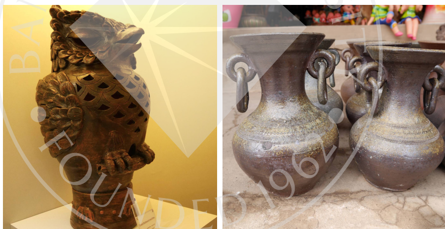
ภาพที่ 2.1: เครื่องปั้นดินเผาด่านเกวียน

เครื่องปั้นดินเผาด่านเกวียน หมายถึง ผลิตภัณฑ์เครื่องปั้นดินเผาที่ผลิตขึ้นในหมู่บ้านด่านเกวียน ตำบลด่านเกวียน อำเภอโชคชัย จังหวัดนครราชสีมา ด้วยภูมิปัญญาท้องถิ่นในกระบวนการผลิตประกอบกับดินที่นำมาปั้นเป็นเครื่องปั้นดินเผาด่านเกวียน จะใช้ดินเหนียวเนื้อละเอียดที่ขุดขึ้นมาจากริมฝั่งแม่น้ำมูลในบริเวณหมู่บ้านด่านเกวียนเท่านั้น ทำให้เครื่องปั้นดินเผาด่านเกวียนมีคุณลักษณะเฉพาะคือ แข็งแกร่ง ทนทาน เมื่อเคาะจะได้ยินเสียงกังวานใสคล้ายการเคาะโลหะ อุ่มน้ำได้ดี และมีสีเฉพาะตัว คือ สีแดงเลือดปลาไหล สีสัมฤทธิ์ หรือสีน้ำตาลดำมันเงา 3