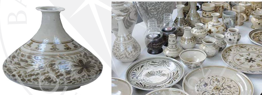
ภาพที่ 2.7: เครื่องปั้นดินเผาเวียงกาหลง

ที่มา: กรมส่งเสริมวัฒนธรรม. (ม.ป.ป. ข). งานช่างฝีมือดั้งเดิม เครื่องปั้นดินเผาเวียงกาหลง. สืบค้นจาก http://ich.culture.go.th/index.php/th/ich/traditional-craftsmanship/241-craft/174--m-s .